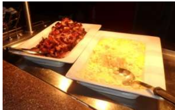
Frukostens "Grand Prix"!